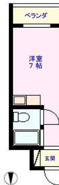
Bタイプ (15.68m 2 )