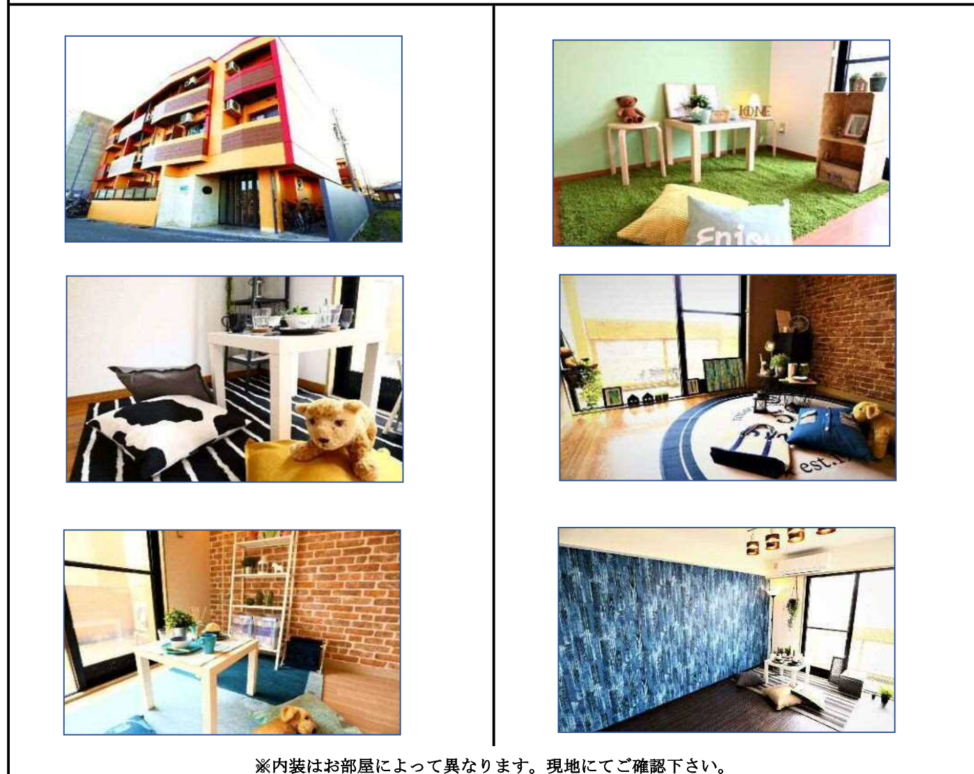
※内装はお部屋によって異なります。現地にてご確認下さい。