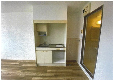
◎図面や画像と現状に相違がある場合は現状優先とします