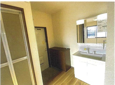
○図面や画像と現状に相違がある場合は現状優先とします